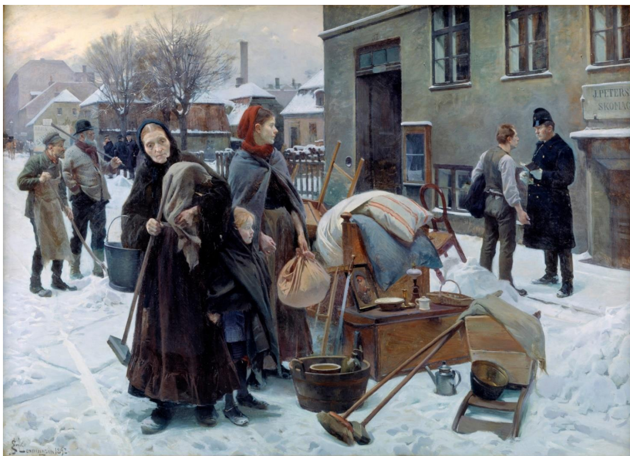
Erik Henningsen: Sat ud (1892)

Siden slutningen af 1800-tallet har der været to overordnede tendenser i dansk litteratur, nemlig en realistisk og en modernistisk. Der er tale om tendenser, der findes inden for alle kunstarter, men som nok er lettest at få øje på inden for malerkunsten, hvor forskellene er mest åbenlyse. En kort omtale af fire danske malerier kan derfor også give et indtryk af de væsentligste forskelle på realisme og modernisme inden for andre kunstarter, heriblandt