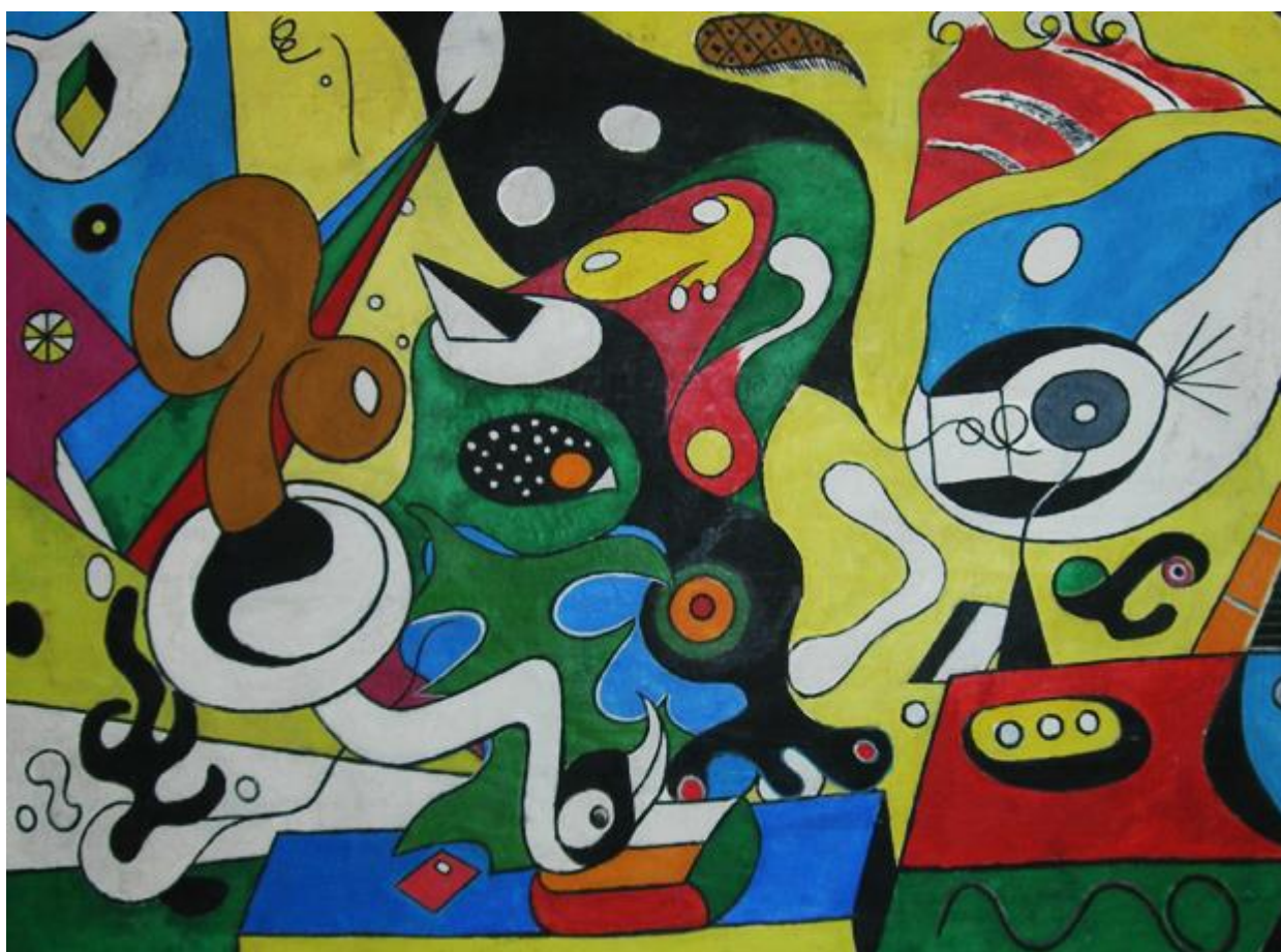
Ejler Bille: Komposition (u.å.)

maleriets titel – kan vi udmærket se, hvad der er billedets motiv. Vi kan også uden besvær få øje på den vej, der går ind i skoven. Men til gengæld er selve skoven malet på en måde, så motivets forskellige elementer går ud i ét, således at de ikke kan adskilles fra hinanden. Vi fornemmer nok, at det vi ser, er træer, buskads og andre elementer, som vi forventer at finde i en skov. Men de forskellige elementer er malet på en måde, så de ikke umiddelbart lader sig identificere, men blot opleves som en helhed af former og farver. Maleriet er i højere grad kunstnerens oplevelse af en skov end det er en realistisk gengivelse af skoven. Vi har forladt den objektive skildring og har nærmet os til en mere subjektiv modernistisk stil.